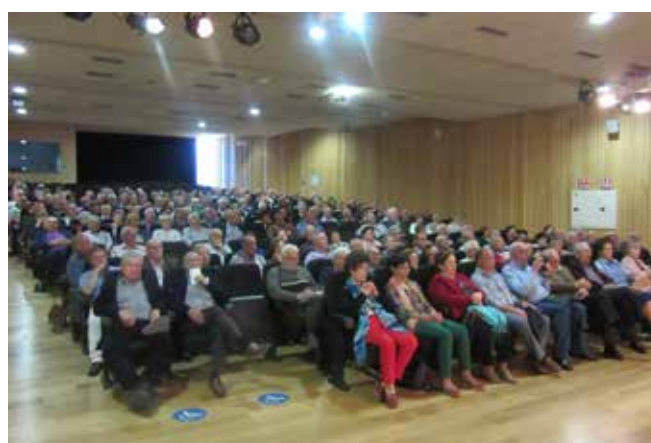
Cuenca 23 de mayo