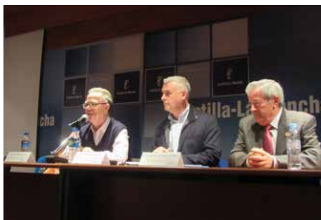
Toledo 6 de noviembre