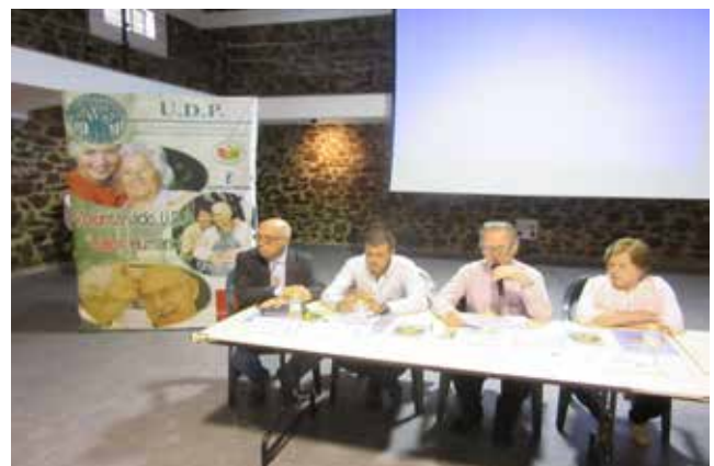
Puebla de Don Rodrigo