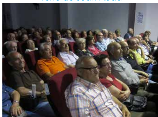
Campillo de Altobuey