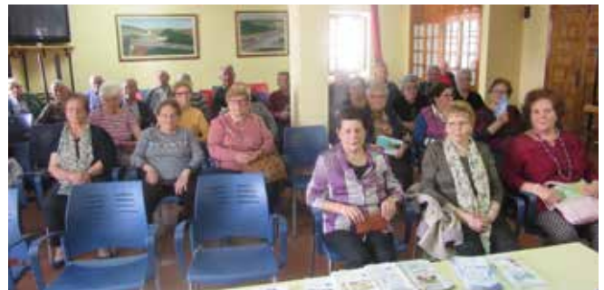
Charla de Sensibilización en Munera