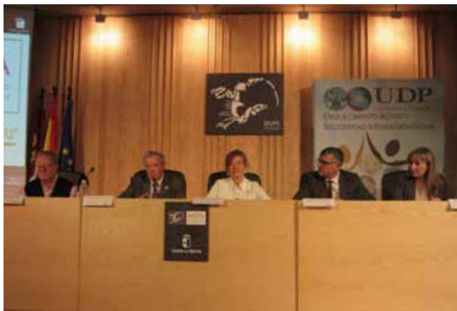
Cuenca 19 de octubre