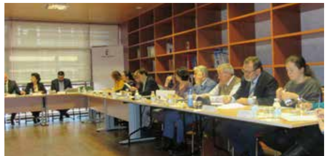
Bienestar Social. Albacete