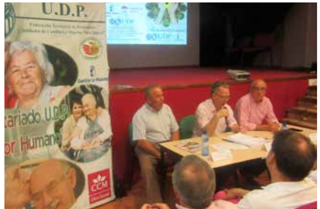
Torre de Juan Abad