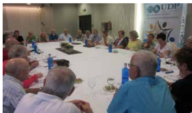
Asamblea de la Federación Territorial el 18 de septiembre