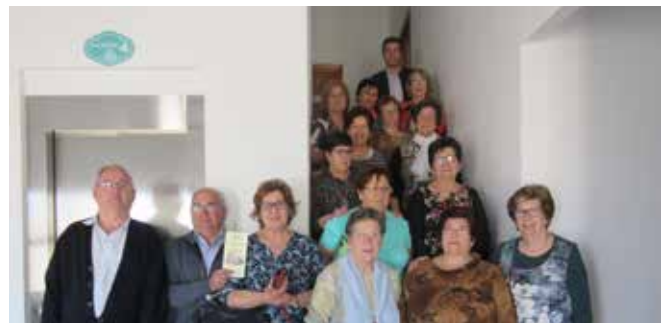
Curso Básico Iniesta