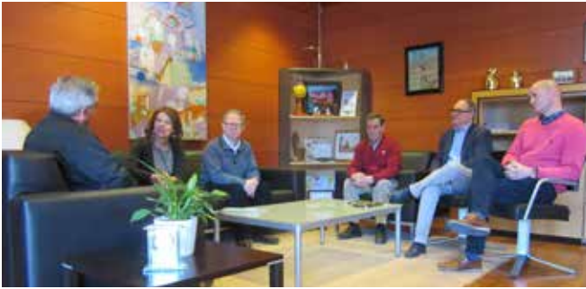
Consejería de Bienestar Social Toledo