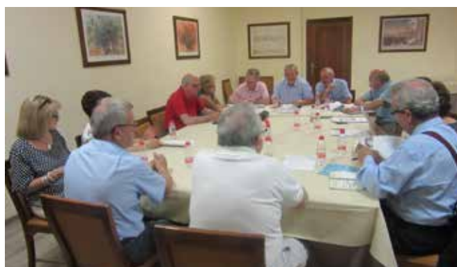
Reunión de la Junta Directiva