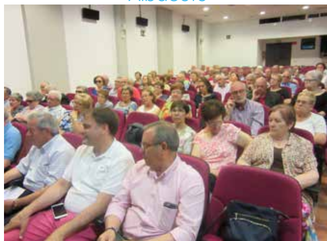
Torre de Juan Abad