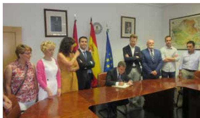
Acto Institucional en Cenizate el 16 de julio