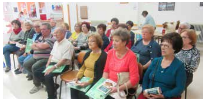
Curso Básico Pozohondo