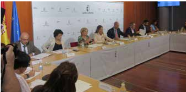
Consejo Asesor de Servicios Sociales