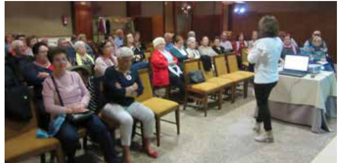
Curso Coordinadores Albacete