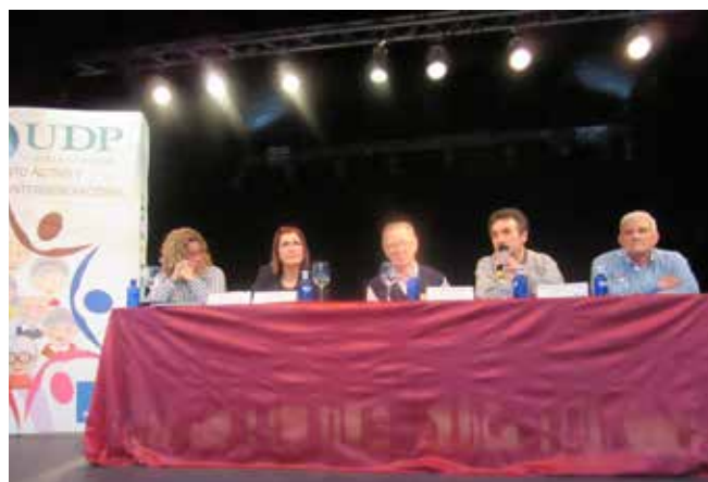
Madrigueras 9 de mayo