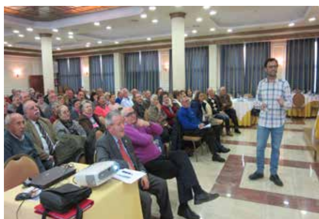
Talavera de la Reina 13 de abril