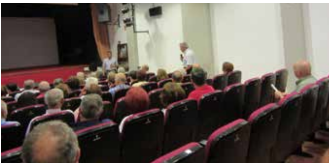
Charla de Sensibilización en Torre de Juan Abad