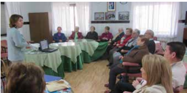
Curso Básico Navas de Jorquera