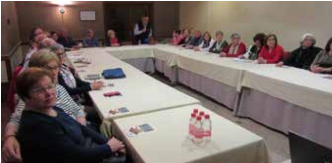
Curso Básico Albacete