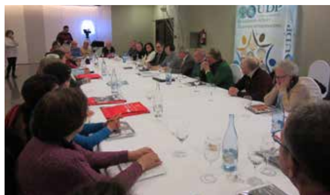
Asamblea de la Federación Territorial el 22 de marzo