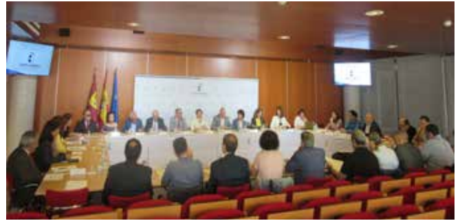
Consejo Asesor de Bienestar Social