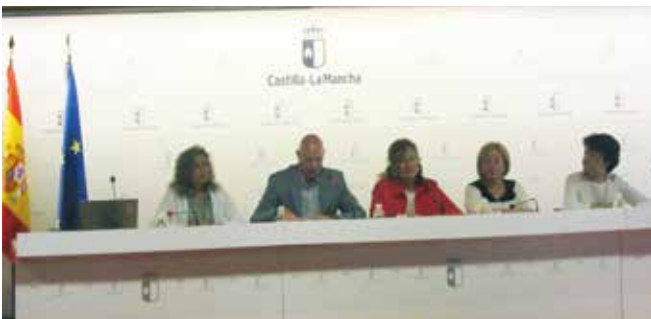
Prestaciones de Servicios Sociales y Dependencia