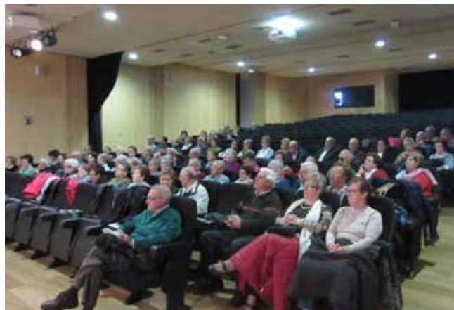
Guadalajara 24 de octubre