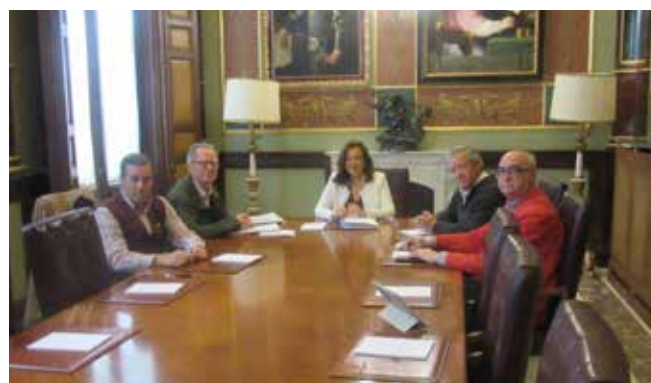
Reunión en la Diputación de Ciudad Real