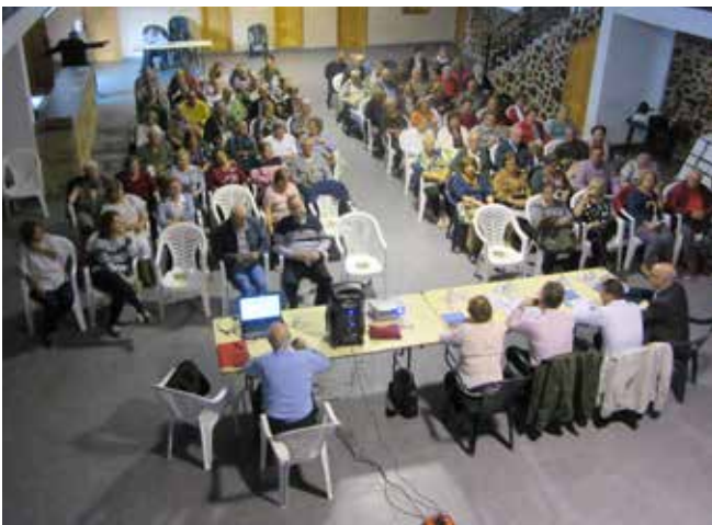
Puebla de Don Rodrigo

En esta ponencia se desarrollaron aspectos por un lado, relacionados con la importancia del voluntariado como un recurso que apoya a familiares de Personas Mayores proporcionando el llamado “respiro familiar” como estrategia de prevención del maltrato a Personas Mayores. De cómo podemos estar activos realizando una labor de voluntariado y los múltiples benéficos que aporta el voluntariado. Haciéndolos participes de nuestro programa de “Voluntariado Social UDP”.