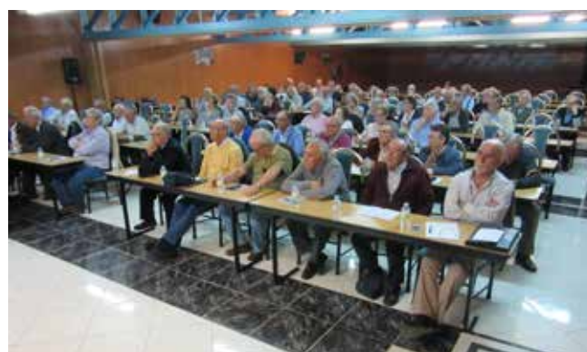
Toledo 27 de abril