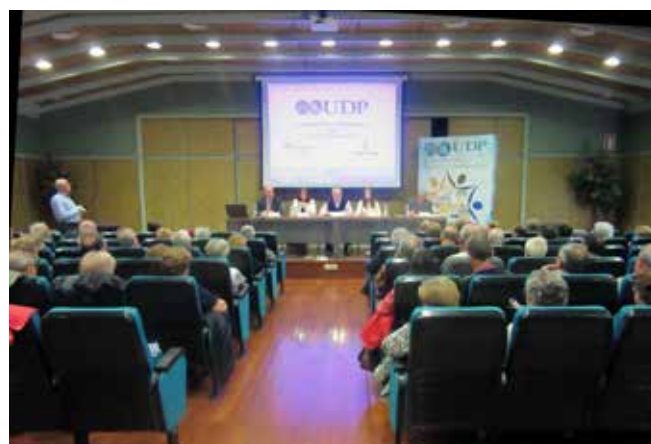
Ciudad Real 18 de mayo