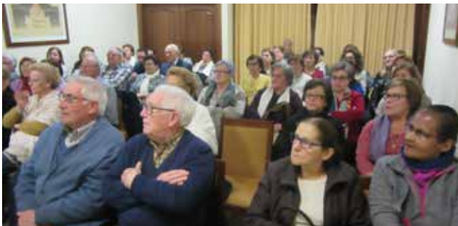
Curso Básico Albacete