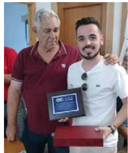
El presidente entrega la placa al nieto de Isabel