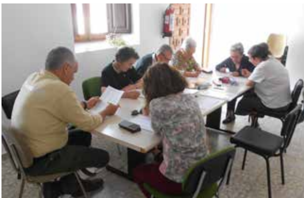
Piqueras del Castillo