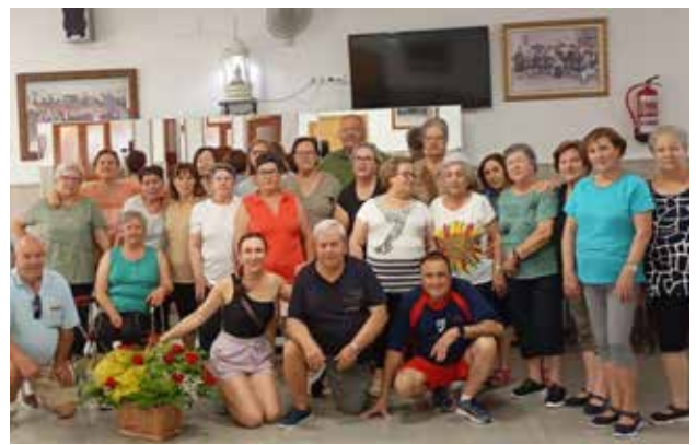
La Puebla de Almoradiel