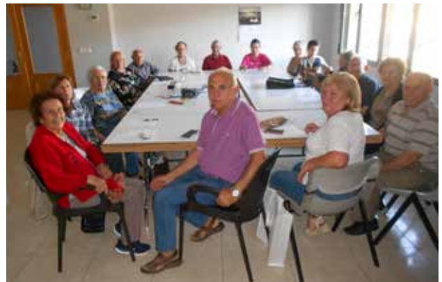
Graja de Iniesta