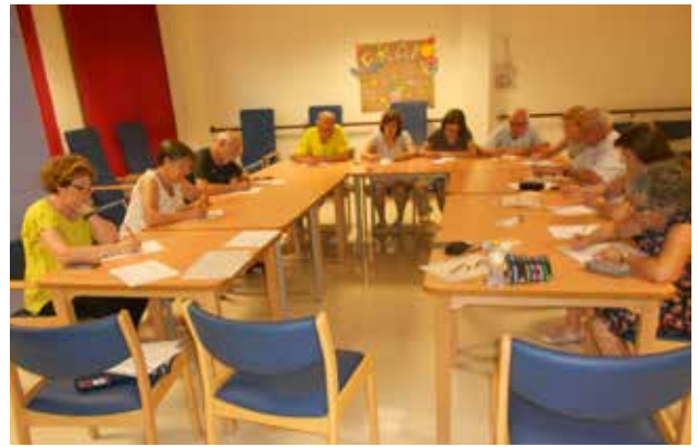
Villalgorido del Jucar