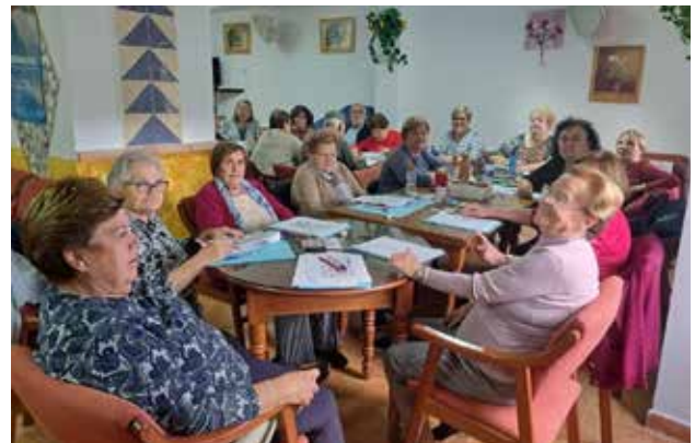
Villaverde de Guadalimar