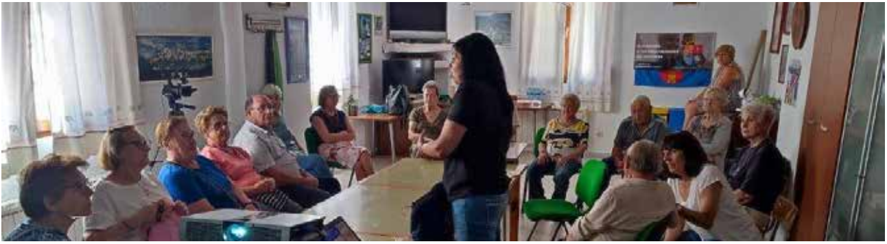
Salinas del Manzano