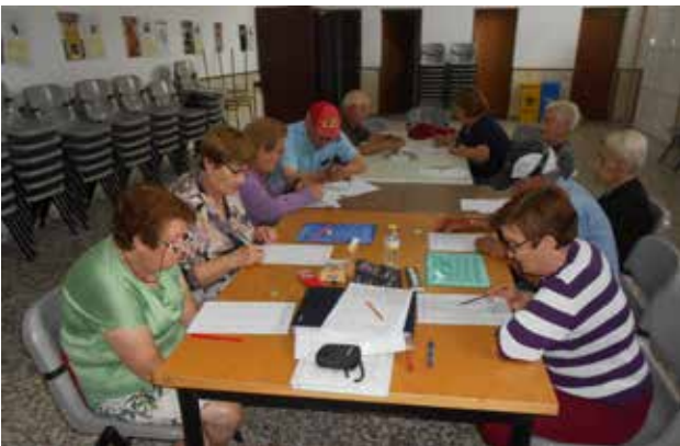
Carrasposa de Haro