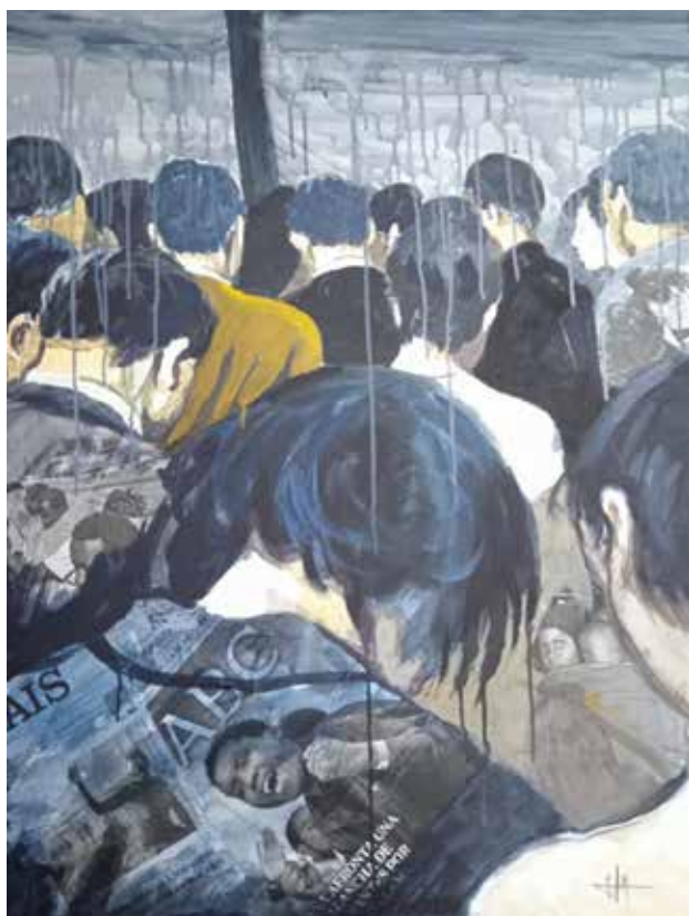
Mirando hacia otro lado

Acuarelas realizadas por M a José Martínez Martínez