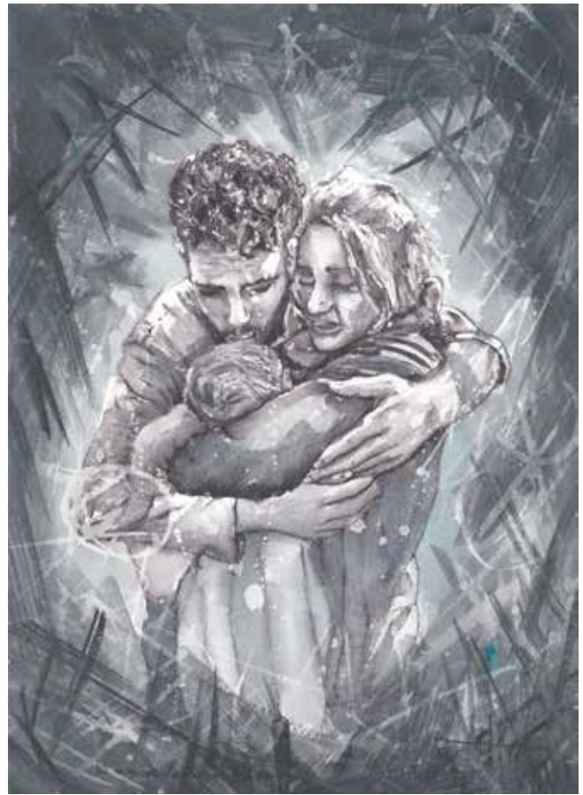
El amor ante el caos